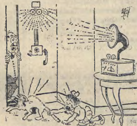
Z MUZYKI KAMERALNEJ. Kwartet.

(Niefortunni sekciarze). Sekciarze baptyści urządzili onegdaj we wsi Pawłów gminy Petrowicze, pow. Lubelskiego zebranie, na którym ich biskup usiłował namawiać tamtejszą ludność do wstępowania w szeregi sekty. Po półgodzinnym przemówieniu zebrani odruchowo dotkliwie pobili prelegenta i jego zwolenników i wyrzucili za drzwi. Niefortunny ten występ odstraszy zapewne misjonarzy sekty baptystów od występów w Lubelszczyźnie.