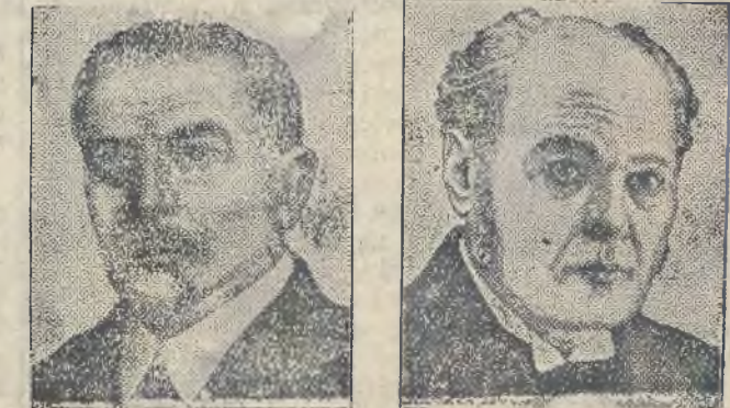
NIEMCY MINISTRAMI W GABINECIE CZECHOSŁOWACKIM. Prezes ministrów p. Svehla. Minister pracy prof. Spina.

Warszawa, 16. 10. „Echo de Paris” podaje, że pogłoski dotyczące stanowiska rządu Poincarego w sprawie spłat pożyczki amerykańskiej są o tyle niesprawdzone, iż rząd nie powziął w tej mierze żadnej decyzji i sprawa ta poddana będzie rozważaniu na najbliższym zebraniu parlamentu.