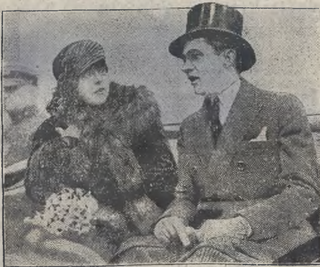
POWITANIE KRÓLOWEJ RUMUŃSKIEJ W NOWYM JORKU.

Wobec tych refleksji oczywistym obowiązkiem nas wszystkich jest współdziałać z nim, aby dzieło Opatrzności zostało spełnione. Wzywam was do modłów dziękczynnych za to, że Bóg jeszcze raz ocalił Włochy, ocalając życie naszego premiera.