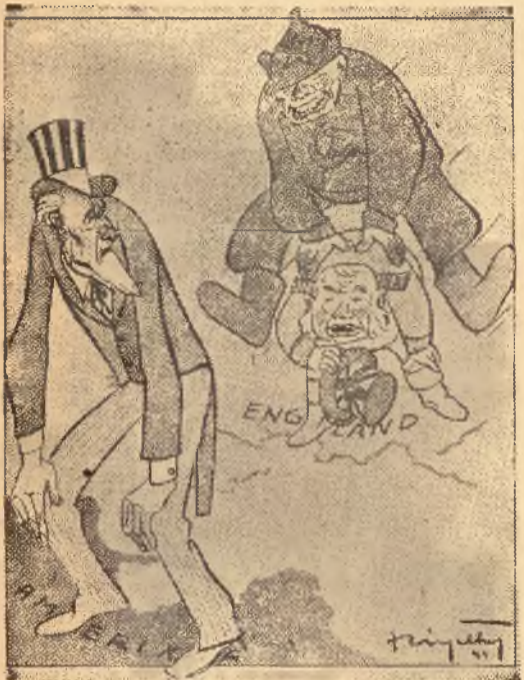
„Trzej sojusznicy” („Lustige Blätter”)

W każdym wypadku ujęcie zbiorów, a temsamem wyżywienie ludności, pracującej bezpośrednio na zapleczu frontu zachodniego, musi być zabezpieczone i nchronione przed złośliwymi elementami. Z tego powodu, podobnie jak już