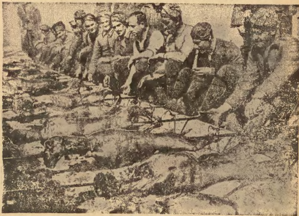
Rokrocznie obchodzi wojsko i ludność Grecji uroczystość Euzonów, przyczem nie brak tańców i wszelkiego rodzaju rozrywek, w których biorą udział również najwyższe władze kraju. Na naszych zdjęciach widzimy fragmenty tego święta: (po lewej) tańce na ulicach rozradowanej ludności i (po prawej) pieczenie baranów na rożnie na tradycyjną uczelę.