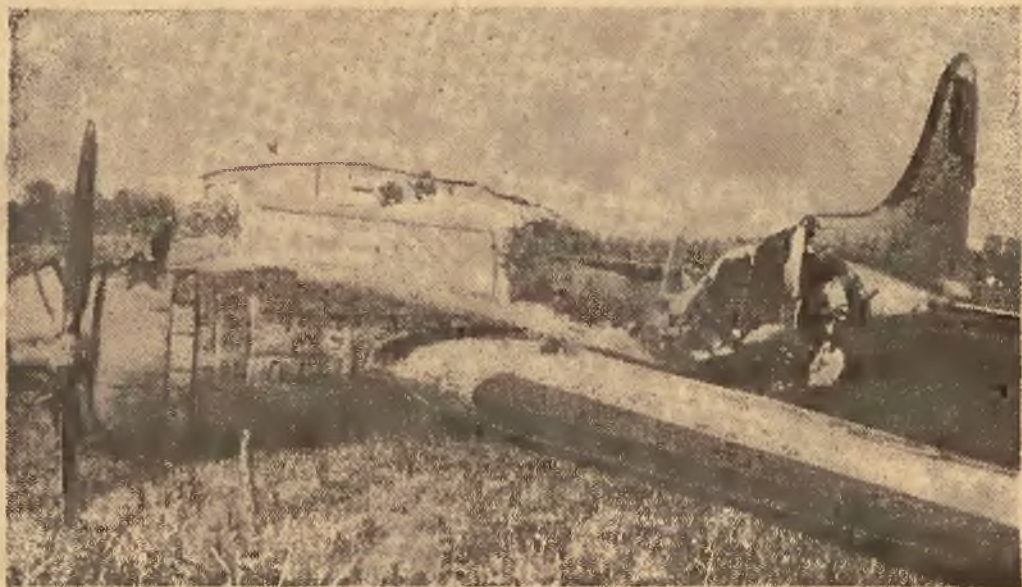
Oto samolot amerykański, który podczas nalotu na teren Rzeszy został zestrzelony przez niemieckie myśliwce.

Jeszcze przed rozpoczęciem ostatnich niemieckich ataków nowa bronią na Londyn, panował w stolicy angielskiej rozpaczliwy brak domów. Według ostrożnej oceny, brak