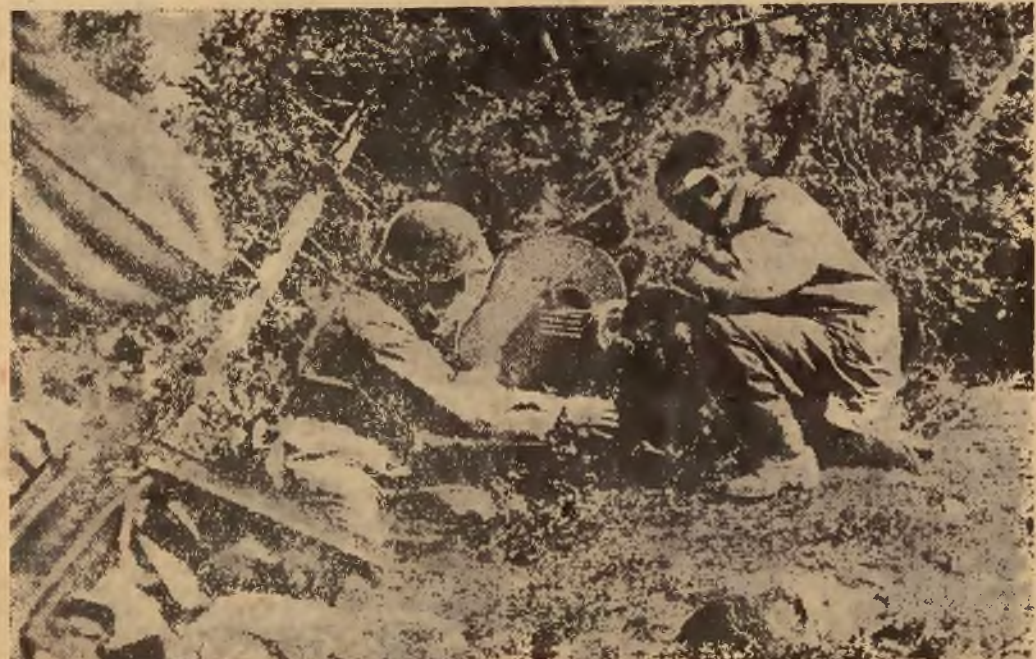
Dobrze ukryty karabin maszynowy na pewnym odcinku frontu wschodniego.

Był to już trzeci samolot amerykański, który w ciągu piątku wylądował w Szwecji.