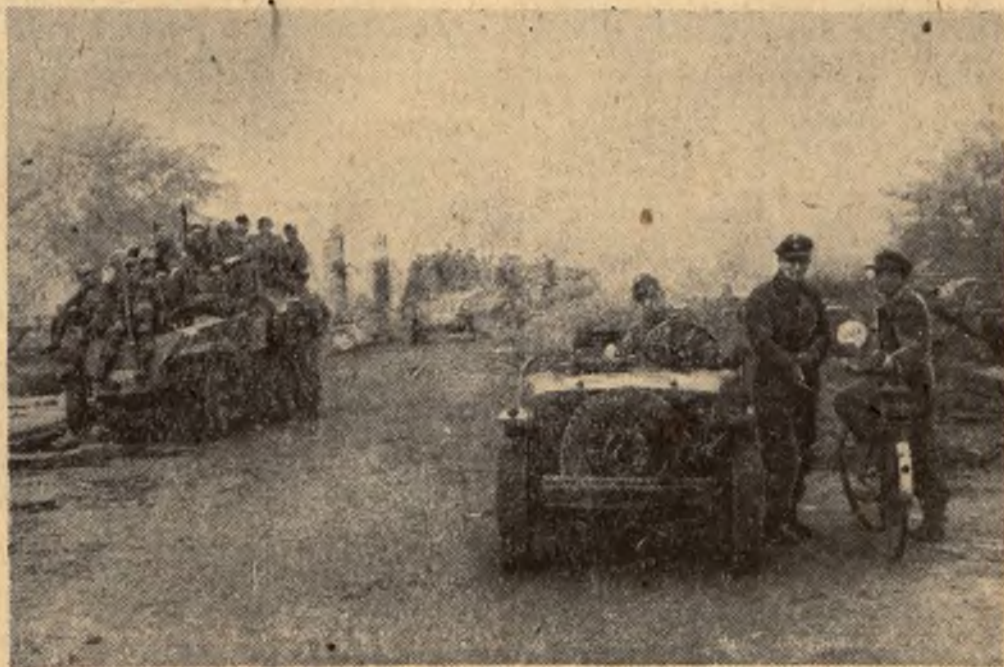
Silniejsza niemiecka formacja wywiadowcza posuwa się naprzeciw oddziałów albańskich.