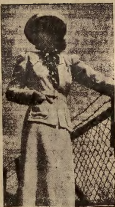
Gustowny i niezwykle elegancki kostium z białej welenki.

Pożar lasu, który wybuchł 28 lipca w okolicy Letourneux, nie został dotychczas ugaszony. Państwem ognia padło przeszło 7000 ha lasu. Rozszerzający się ogień zagraża okolicznym osiedlom i winnicom.