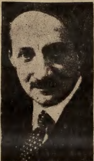
Minister finansów George Bonnet, któremu Prezydent Republiki powierzył misję tworzenia rządu.

Według opinii kół parlamentarnych dotychczasowa opozycja socjalistów i komunistów przeciw osobie Bonneta, o ile nie obali w najbliższym czasie nowej kombinacji ministerialnej, to w każdym razie może poważnie utrudnić przyszłe zadania nowego premiera.