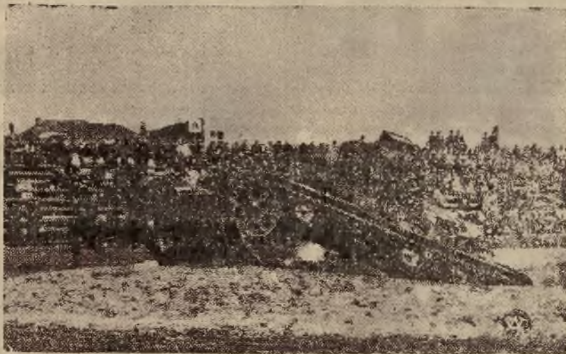
Czołg w akcji na terenie ze specjalnie ustawionymi przeszkodami (mur z cegieł, rowy, płoty).

Imponujące pokazy wojskowe odbyły się w Warszawie w dniu 3 Maja, którym przyglądało się z olbrzymim zainteresowaniem około 200 tysięcy widzów. Reprodukujemy kilka fragmentów z wspomnianych pokazów wojskowych.