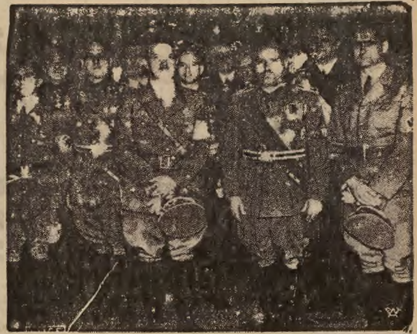
Reproduujemy zdjęcie, przedstawiające moment po wizycie, złożonej przez kanclerza Hitlera Mussoliniemu w pałacu weneckim w Rzymie. Stoją od lewej: minister Goebbels, minister hr. Ciano, kanclerz Hitler, Mussolini, minister Hess.