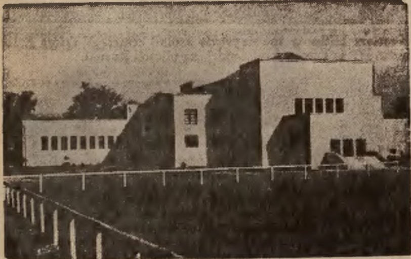
Reprodukcujemy zdjęcie, przedstawiające okazały gmach Izby Kultury Fizycznej w Kownie.

SYDNEY. Australijski Związek Tenisowy dopiero teraz opublikował listę najlepszych swoich tenisistów. Na czele listy znajduje się 19-letni John Bromwich, 2) Quist, 3) Mac Grath, 4) Crawford.