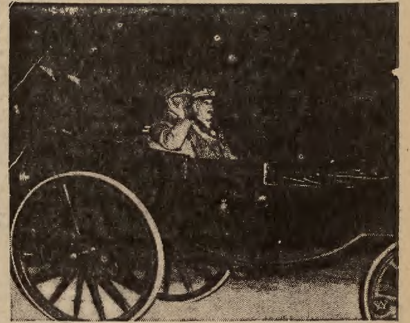
Kanclerz Hitler w towarzystwie króla i cesarza Wiktora Emanuela III w karocy królewskiej na ulicach Rzymu.