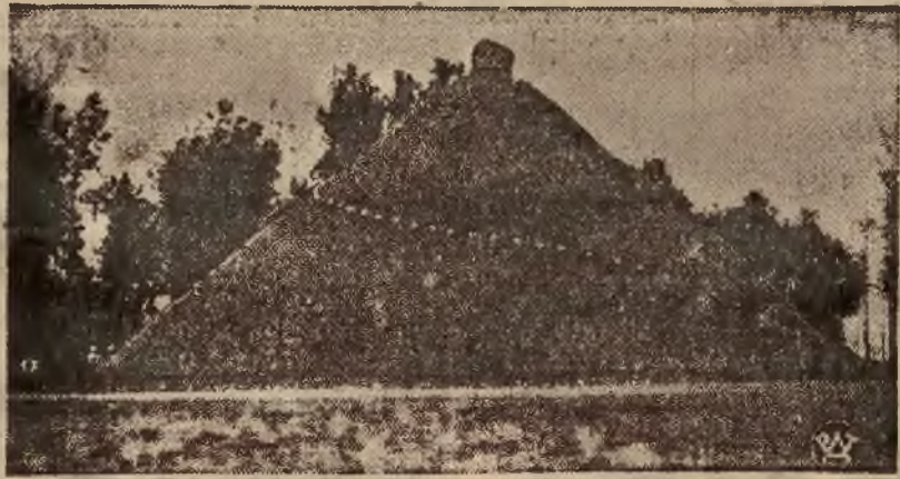
W dniu 15 maja odbędzie się w obecności przedstawicieli władz we wsi Zawada - Majówka, gminy Przesmyki, powiatu siedleckiego, uroczyste poświęcenie kopca, wzniesionego samorzutnie pracą własnych rąk przez włościan powiatu siedleckiego dla uczczenia pamięci Wielkiego Marszałka Polski, Józefa Piłsudskiego.

Narływ do Szkoły Podchorążych Lotnictwa (grupa techniczna) jest bardzo duży. Zaledwie tyłko pewien odsetek podań może być uwzględniony. Kierownictwo szkoły wybiera oczywiście najlepszych kandydatów, by w ten sposób stworzyć najlepszy korpus techniczny dla naszego lotnictwa.