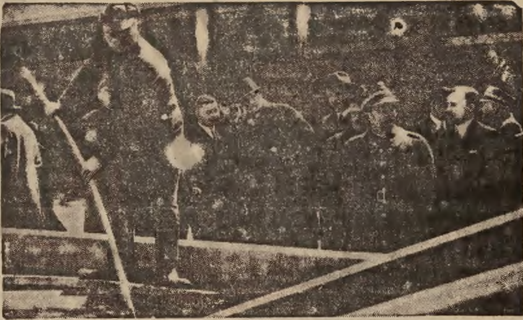
Pan Prezydent Rzeczypospolitej na terenie nowopowstałej fabryki celulozy w Niedomicach. Stoją od lewej: p. wicepremier Kwiatkowski, Pan Prezydent Rzeczypospolitej, p. minister Roman, p. minister Kasprzycki.