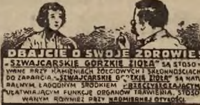
DBAJCIE O SWOJE ZDROWIE! SZWAJCARSKIE GÓRZKIE TIGER SA STOSOWANE PRZY KAZDYM NIEPOKŁOJENIU I SPOSOBNOSC DO ZAPARCIA. SZWAJCARSKIE B. TIGER SA WARTYM LECZENIEM SPOSOBNYM W ZWIĄZANIU Z WYMIENIĄCZĄCĄ KREWIA I ORGANÓW TRAWIENIA, STOSOWANYM RÓWNIEŻ PRZY NADMIERNEJ CIĘŻARCI.

Na odcinku wybrzeża Morza Śródziemnego powstańcy odparli szereg gwałtownych ataków nieprzyjaciela, który pozostawił na placu boju przeszło 100 zabitych.