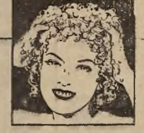
Palmolive Shampoo pielęgnuje włosy jak mydło Palmolive cerę.

Oleje oliwkowy i palmowy użyte do wyrobu tego doskonałego Shampoo myją gruntownie i przywracają włosom puszystość i naturalne piękno, ułatwiają układanie się ich w fale.