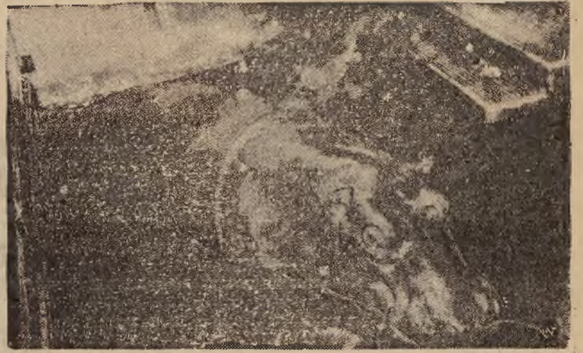
Na zdjęciu — okazały hipopotam w Zoo w Kopenhadze wraz z nowonarodzonym swym potomkiem.

Ponieważ przewód całkowicie potwierdził obronę, ponadto zaś powiatowy komendant PP. wydał o Watale jak najlepszą opinię, Sąd pod przewodnictwem s. o. Kryczyńskiego uwolnił Watałę od winy i kary.