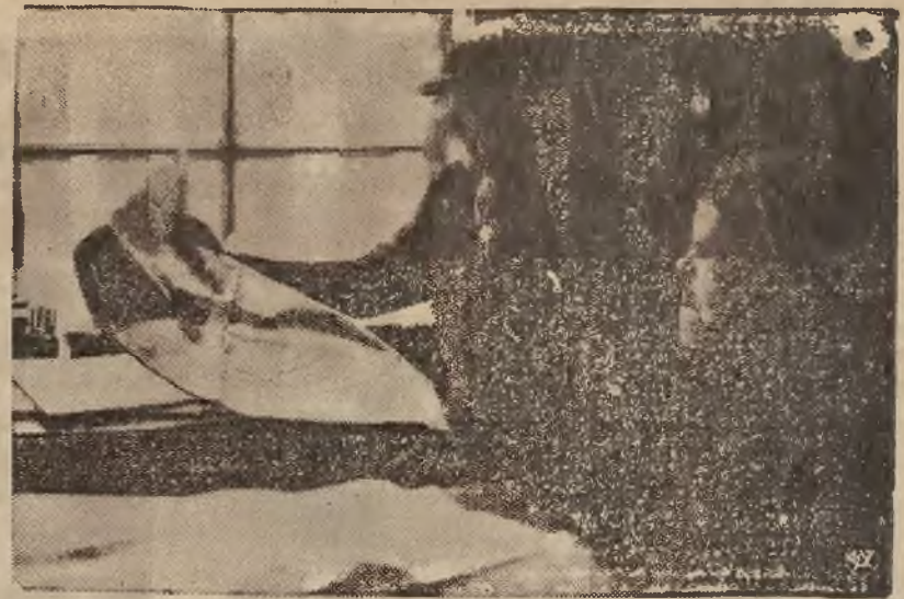
Pani Marszałkowa Aleksandra Piłsudska zaszczyliła swą obecnością odbywające się w Warszawie Centralne Kobiectwo Zawody Szachowe. Na zdjęciu: Pani Marszałkowa Piłsudska przegląda tarcze z wynikami.

W szkole tej młode dziewczęta niemieckie będą mogły zanożyć się z zadaniami przyszłej żony i matki. W najbliższej przyszłości po poczynieniu doświadczeń z pierwszą szkołą, otwarte będą dalsze „szkoly dla żon”.