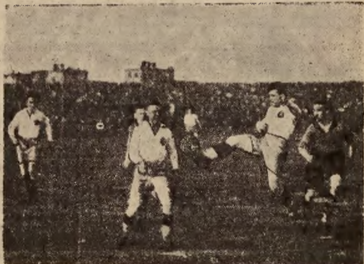
Na zdjęciu - fragment z meczu piłkarskiego Anglia - Śląsk, rozegranego w Katowicach w dniu 18 b.m. Reprodukujemy moment przed bramką Śląska.

Walka Punceta z Shayesem została jednak przerwana z powodu ciemności przy stanie 6:4, 4:6, 6:2, 3:2 dla Jugosławianina. Jugosławia po pierwszym dniu prowadzi 1:0.