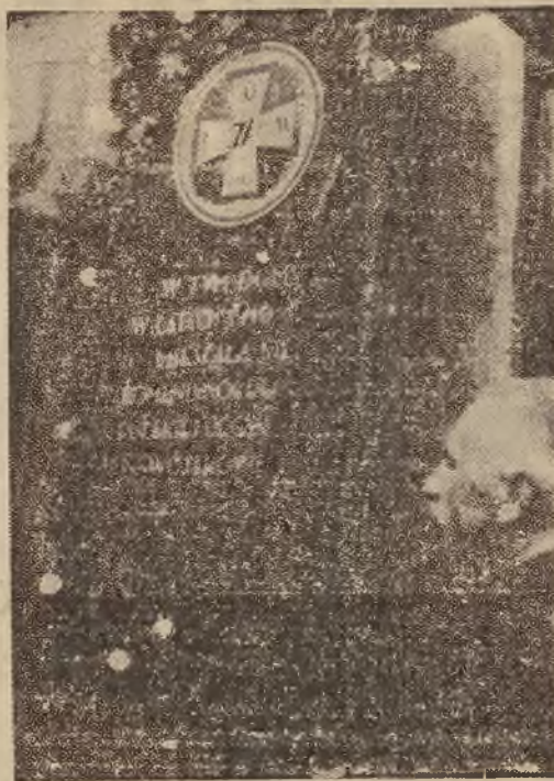
Ostatnio odbył się we Włocławku zjazd historyczny okręgu pierwszego P. O. W.