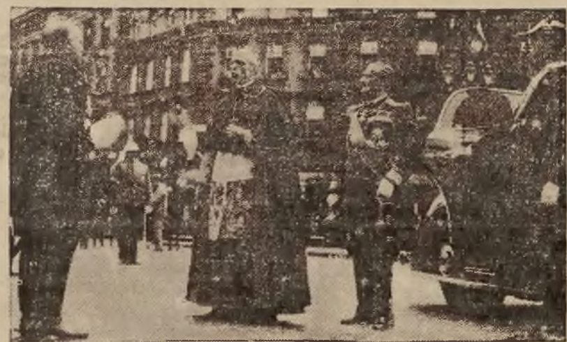
Zdjęcie przedstawia moment po witaniu w Budapeszcie przybyłego z Rzymu w charakterze delegata Ojca Świętego na kongres kardynała Pacello, sekretarza stanu w Watykanie.