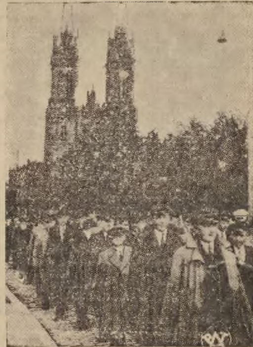
Pochód uczestników zjazdu przez ulice Włocławka był wielką manifestacją bytych członków POW. i wywołał olbrzymie wrażenie. Pochód był zorganizowany wzorowo.

Wojewoda pomorski Władysław Raczkiewicz odsłania tablicę pamiątkową na domu przy ul. Kościuszki nr. 4 we Włocławku, w którym mieściła się komenda okręgu I-go P. O. W.