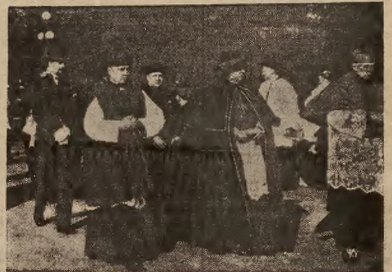
Prymas Polski J. Em. ks. kardynał Hlond w uroczystym orszaku na kongresie Eucharystycznym w Budapeszcie.

Przyjazd więc marszałka Blüchera do stolicy sowieckiej stoi niewątpliwie w związku z doniosłymi decyzjami powziętymi przez rząd sowiecki po rokowaniach z delegatem chińskim.