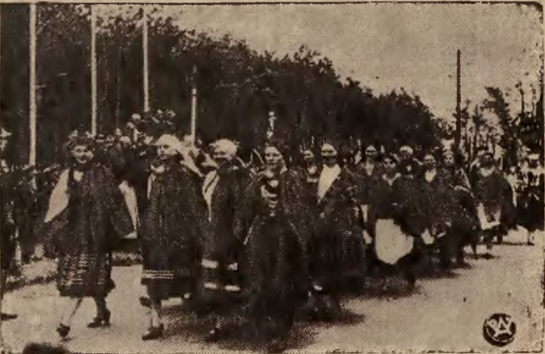
Na zdjęciu fragment defilady lu dności wiejskiej powiatu brzezińskiego w dniu święta pułkowego pułku artylerii ciężkiej w Tomaszowie Mazowieckim. Ludność wiejska, która wystąpiła w swych barwnych strojach, defilując przed trybuną z przedstawicielami władz, wznosiła okrzyki na cześć armii.