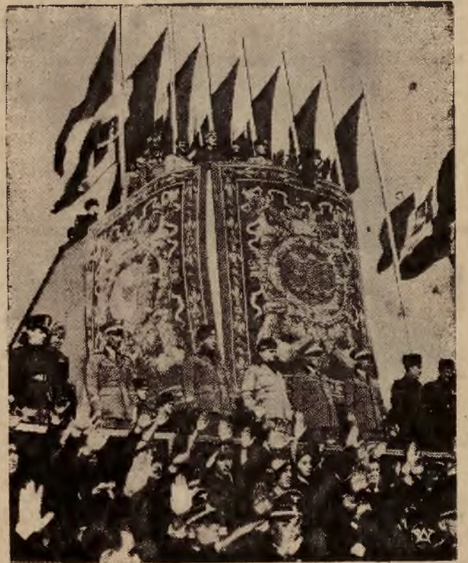
Na zdjęciu — Mussolini przyjmuje na forum Mussoliniego defiladę organizacji faszystowskiej w 12 rocznicę faszystów włoskiego. Po lewej stronie Mussoliniego widoczny na trybunie gen. Millan Astray, jeden z dowódców armii hiszpańskiej, który wraz z delegacją wojsk gen. Franco przybył na uroczystości.