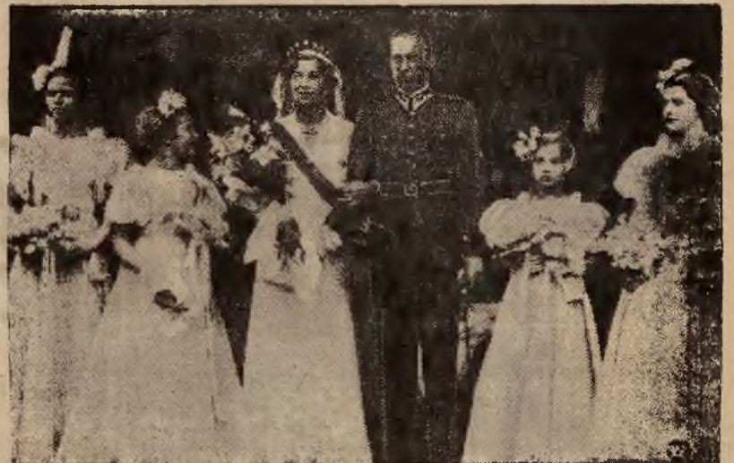
W Paryżu w kościele św. Ludwika u Inwalidów odbył się onegdaj ślub ks. Dominika Radziwiłła z księżniczką Eugenią grecką, córką stryja króla Jerzego. Na zdjęciu młoda para, podczas ceremonii ślubnej. Ks. Dominik Radziwiłł w mundurze oficera polskiego.