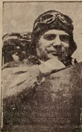
As lotnictwa włoskiego Steppani, zamierza pobić rekord szybkości bezwzględnej.