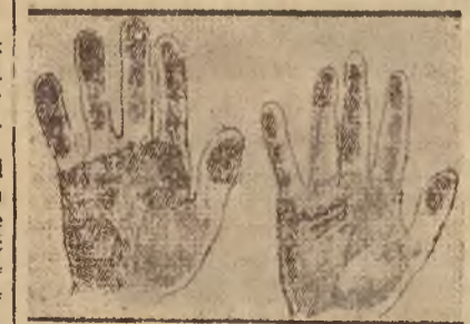
Dłoń Douglasa Fairbanka Dłoń Myrny Loy