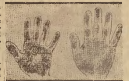
Dłoń Joan Crawford Dłoń Ramona Novarro

— że gwiazda ma wielki talent dramatyczny i specjalne zdolności do sztuki filmowej, ale równocześnie stwierdziłam u niej brak decyzji, siły woli i bardzo chwiejny charakter. Ma przy tym tego rodzaju skłonność, że wyolbrzymia rzeczy drobne, nieznaczne, a bagatelizuje — ważne.