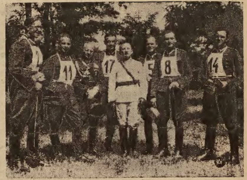
We wtorek 4 b. m. rozpoczął się w Budapeszcie trójmecz w pięcioboju nowoczesnym Polska — Węgry — Szwecja.

bowane swej ofierze, mordercy porzucili na szosie w pobliżu Marrakeszu, przejechawszy nim przed tym idącego żebraka. Zbrodnia ta, będąca jaskrawym dowodem fatalnych stosunków, panujących w szeregach Legii Cudzoziemskiej, jest jeszcze jednym dowodem, jak ciężka jest służba oficerów, stojących na czele oddziałów, składających się z najgorszych szumowin całego świata. (r.)