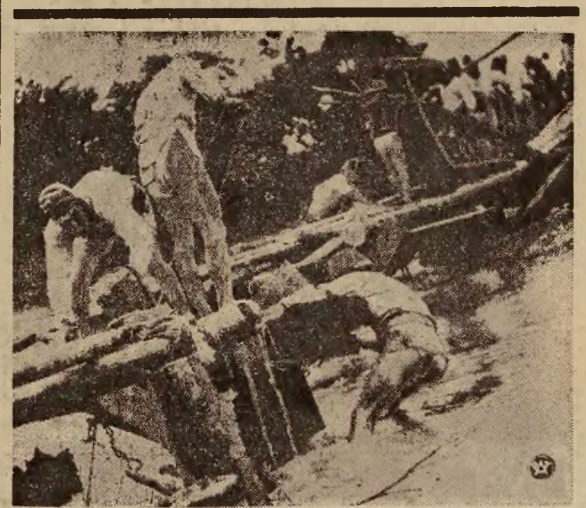
Na zdjęciu — żołnierze japońscy przy naprawie mostu zniszczonego skutkiem katastrofalnego wylewu Rzeki Żółtej.