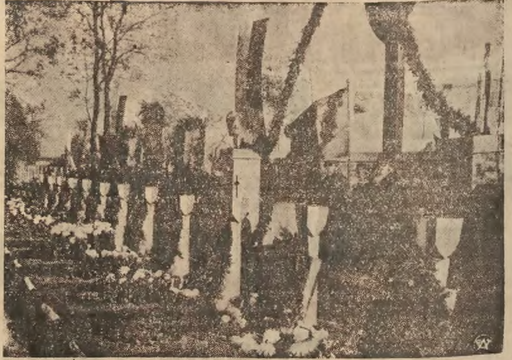
Groby powstańców na cmentarzu na Powązkach w Warszawie