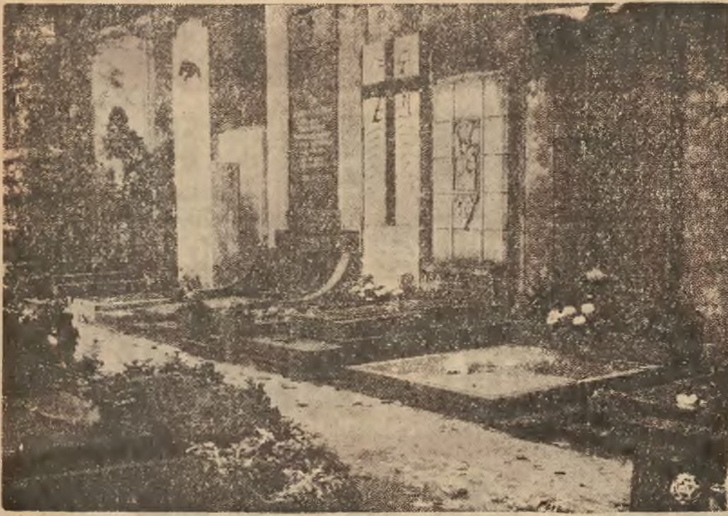
Kwaterna Zasłużonych na cmentarzu Powązkowskim w Warszawie. Na prawo grób bohaterów-przestworzy Żwirki i Wigury.