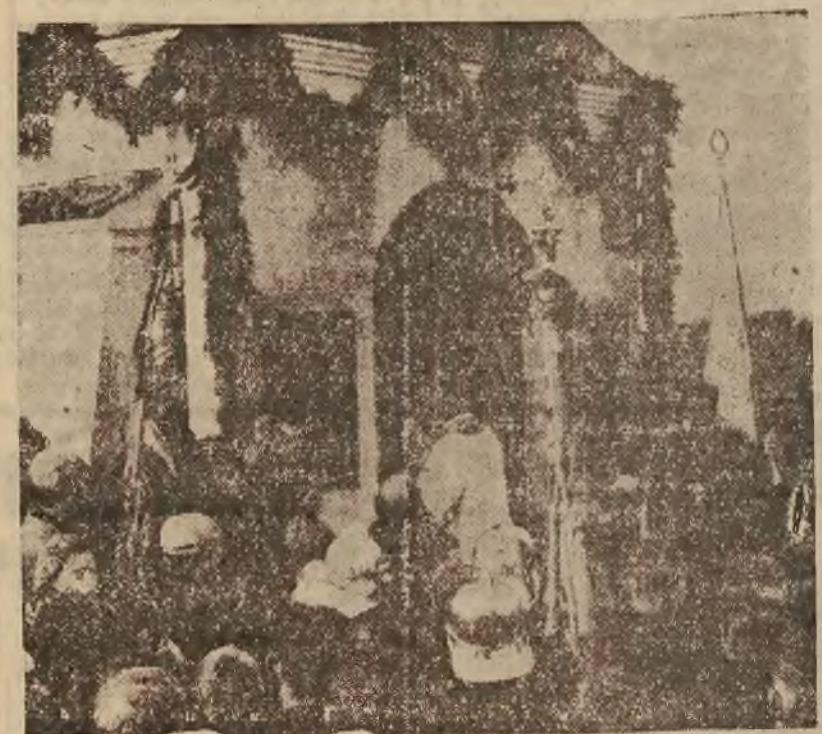
W Bednarach pod Łowiczem odbyło się wczoraj uroczyste poświęcenie kaplicy pomnika wzniesionej przez miejscową ludność dla uczczenia bohaterskiej śmierci Legionistów I Brygady w 1914 r.