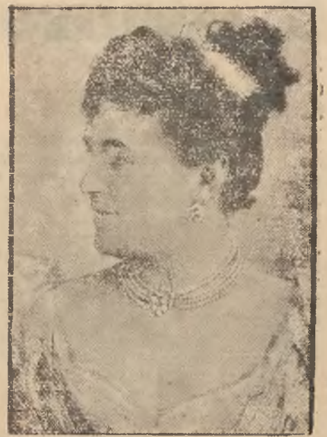
słynna śpiewaczka operowa, zmarła w Nowym Jorku w 76 roku życia.