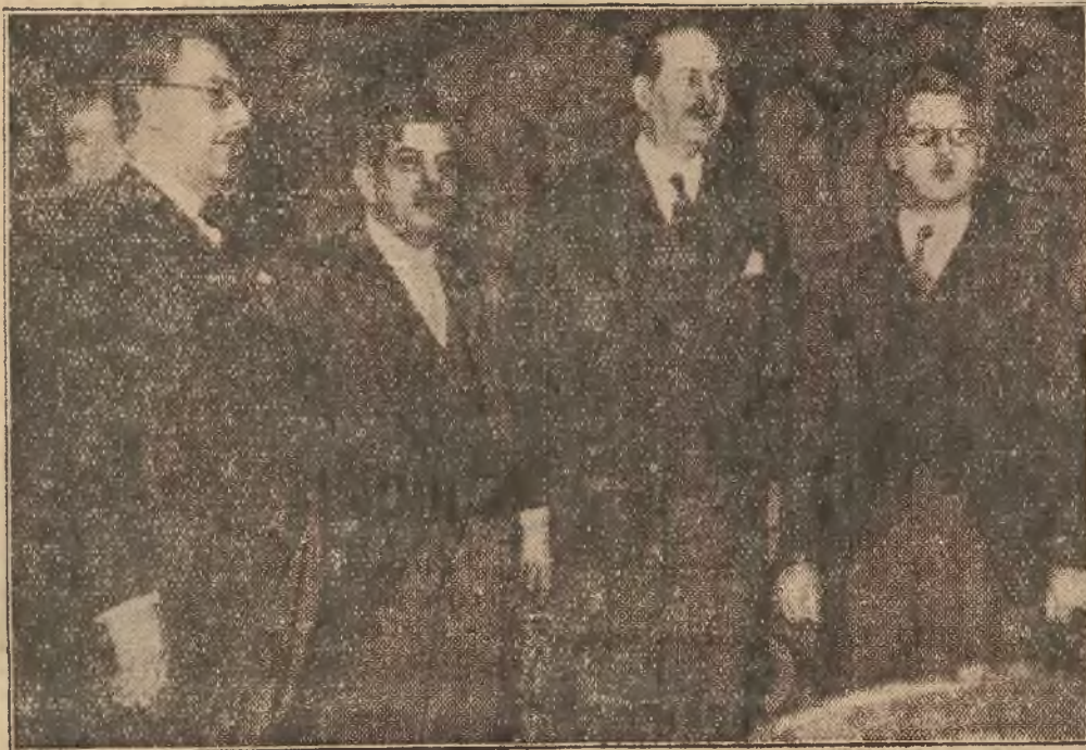
Austrjacki kanclerz dr. Schuschnigg i minister spraw zagr. Berger-Aldenege przebywają obecnie w Paryżu, prowadząc pertraktacje z francuskim rządem. Na zdjęciu od lewej: austrjacki minister spraw zagr. Berger-Walkenegg, francuski minister spraw zagr. Laval, premier Francji Flandin i kanclerz Austrii dr. Schuschnigg.