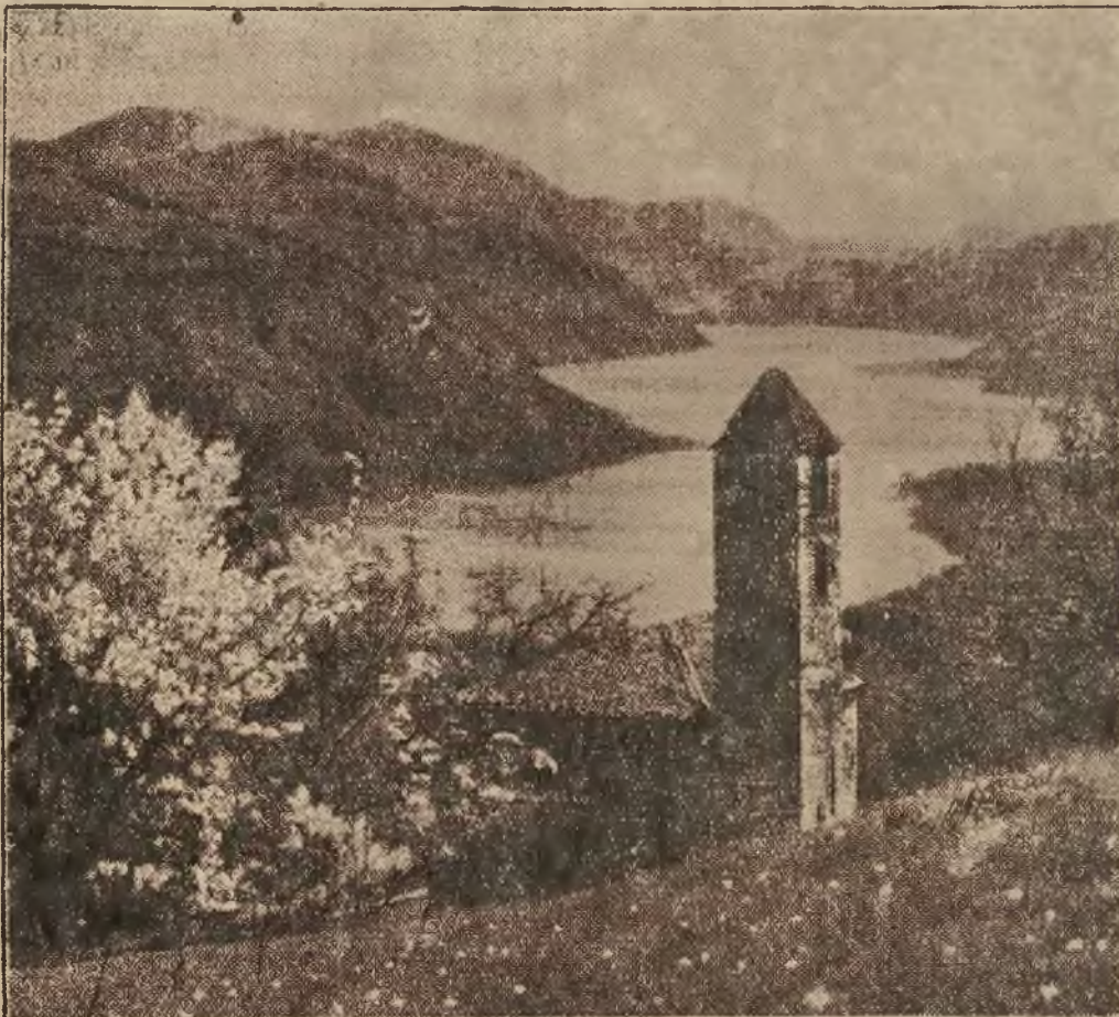
Spóźniona nieco w tym roku wiosna dopiero teraz pokrywa zielenią pola i łąki. W Tatrach i w górach powyżej 1600 metrów jeszcze spoczywa śnieg, który utrzymuje się dzięki rannym przymrozkom i chłodnym nocom. W okolicach natomiast nizinnych drzewa obsypały się już kwieciami.