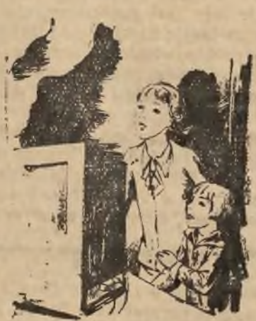
CODZIENNA AUDYCJA RADJOWA W SEZONIE LETNIM

UTWORY FRANCISZKA LEHARA. Któż nie słucha z prawdziwą przyjemnością tak melodyjnych a i nieraz wesołych, pełnych uroku utworów słynnego kompozytora „Wesołej wdówki“ Lehara. Dnia 15 bm. o godz. 22.10 będziemy mieli sposobność przypomnieć sobie wiele dobrze nam znanych wdzięcznych melodji z „Hrabiego Luksemburga“ z „Wesołej wdówki“, z „Frasquity“ itd. w wykonaniu Małej Orkiestry Polskiego Radja.