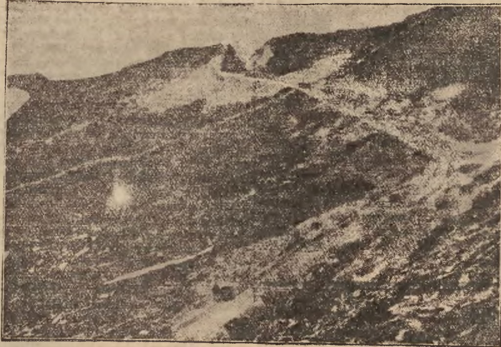
Wkrótce już zostanie ukończona droga prowadząca na Glockner w Alpach. Na zdjęciu widzimy odcinek tej drogi wijący się koło szczytu Toerlkopf.