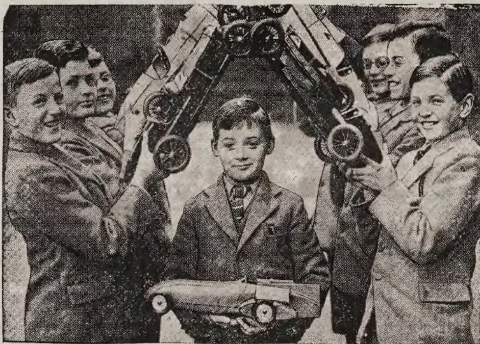
kładają poza wyszkoleniem wojskowym nacisk na techniczne wyszkolenie młodzieży. Młodzi konstruktorzy samochodów entuzjastycznie czczą młodocianego kolegę, zdobywcę pierwszej nagrody.