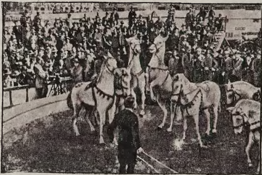
odbył się niedawno we Włoszech, ojczyźnie widowisk cyrkowych. Na ilustracji naszej widzimy zwycięzcę w tresurze koni, otoczonego świetnymi uczniami.