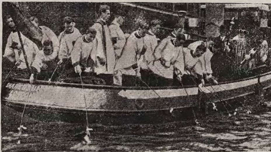
Anglja jest krajem tradycyj. Oto piękny zwyczaj błogosławienia wód przed rozpoczęciem jesiennego okresu rybackiego. Klerycy opactwa Westminsterskiego po krótkich modłach zarzucają wędziska, dokonując pierwszego symbolicznego połowu ryb.