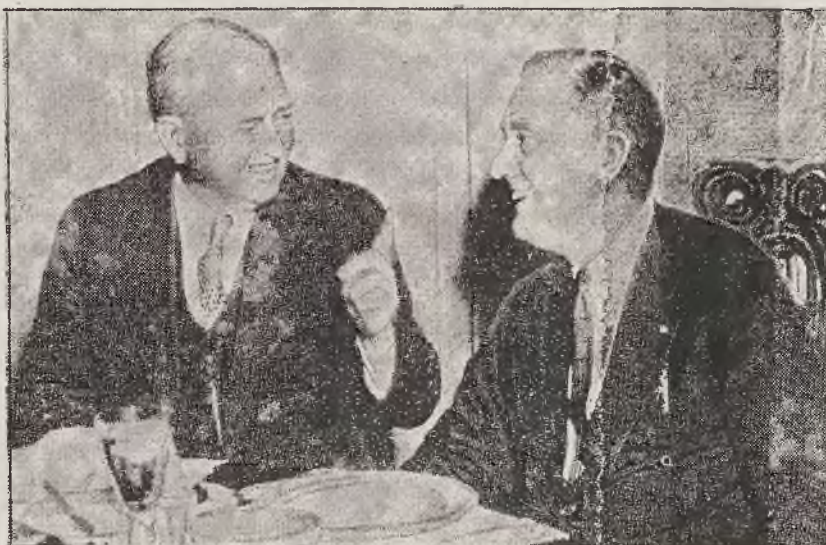
Kandydat demokratyczny Roosevelt (z prawej strony) rozmawia z kandydatem na wiceprezydenta Garnerem.