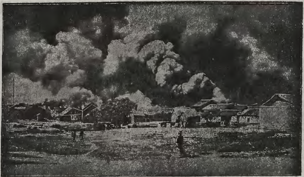
Pożar jednego z miast chińskich w północnej Mandzurji, gdzie ponownie rozgorzały zacięte walki.