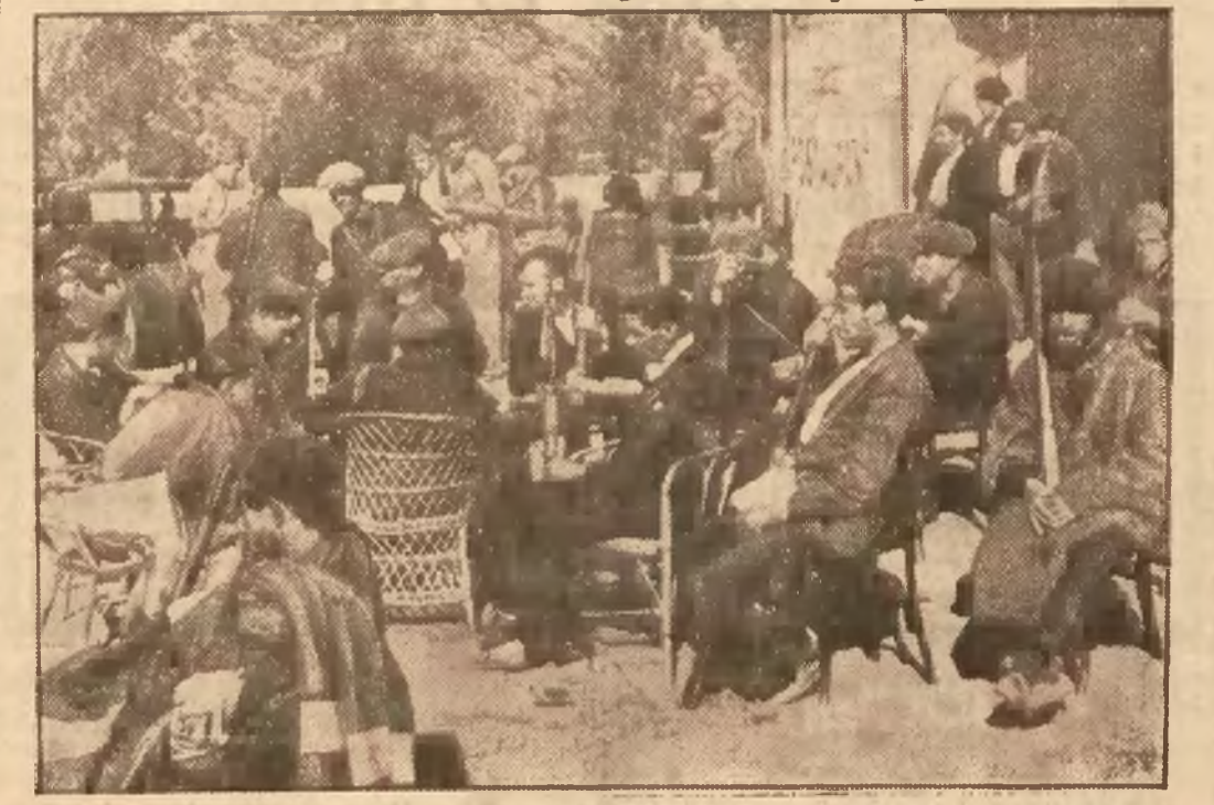
dokonuje licznych egzekucyj. Na zdjęciu widzimy „oddział“ czerwonej milicji odpoczywający w pierwszorzędnej kawiarni madryckiej.

Komornik Sądu Grodzkiego w Tuchowie, Sygnatura Km. 82/36.