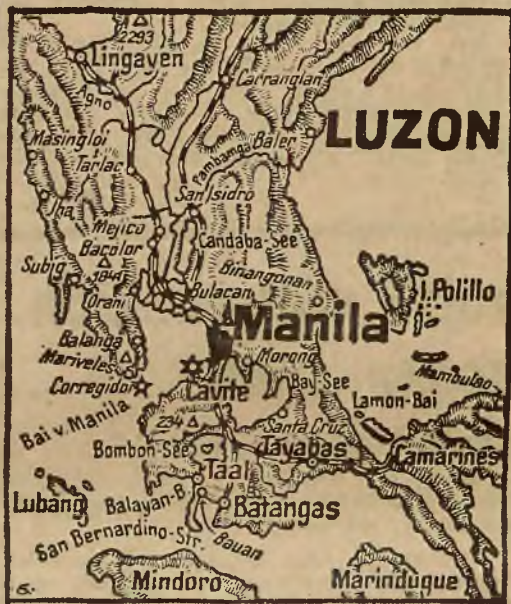
Mapka wyspy filipińskiej Luzon. Twierdzę Corregidor, znajdującą się w zatoce Manill, u wyłotu tejże zatoki, oznacza gwiazdka.

Po zdobyciu półwyspu Bataan przez Japończyków, upadek Corregidoru był już tylko kwestią czasu. Ta skalista twierdza była bowiem zupełnie odcięta od świata zewnętrznego i nie otrzymała żadnych dowozów. Ciężkie japońskie ataki bombowe z ubiegłych tygodni zniszczyły prawie wszystkie wejścia od tuneli i zbiorniki wodne. Corregidor uchodził w amerykańskich kołach wojskowych za „nie do wzięcia”.