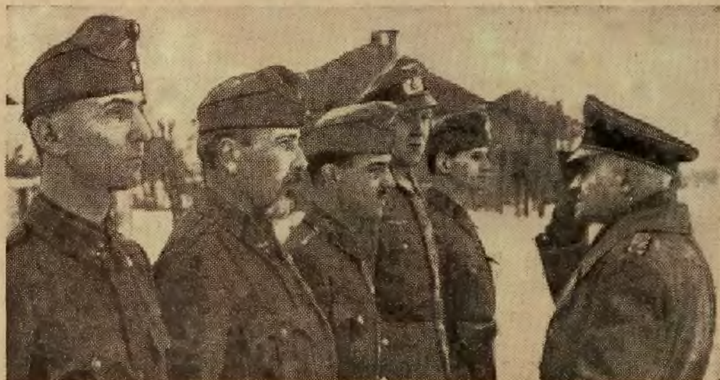
Na froncie wschodnim obok wojsk niemieckich walczą oddziały węgierskie, wykazując dzielną postawę i wielką odwagę. Na zdjęciu powyższym widzimy, jak generał artylerji niemieckiej Heitz dziękuje oficerom węgierskim za okazaną przez nich odwagę. Komendant węgierski został przytem odznaczony Żelaznym Krzyżem.

Uroczystość otwarcia parlamentu japońskiego.