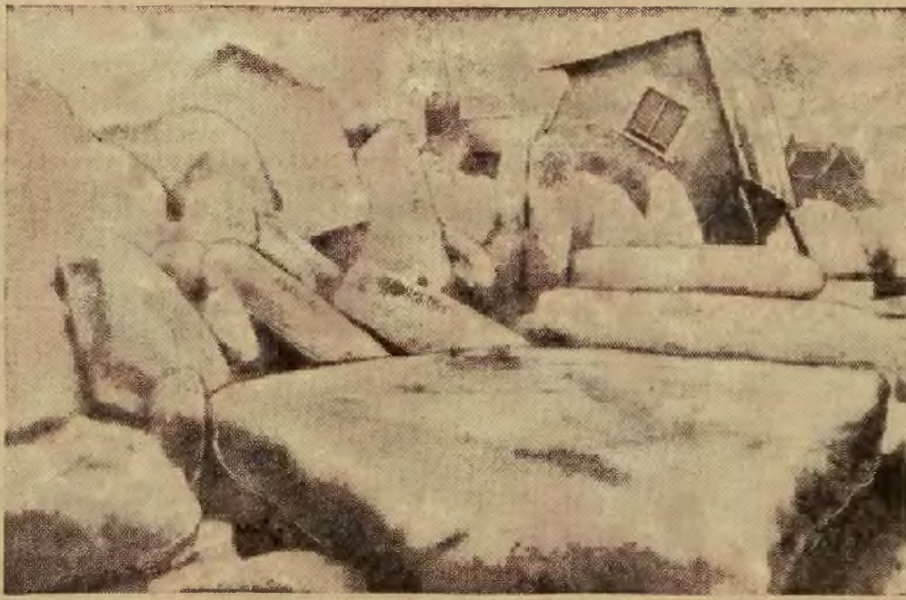
Fragment rzeki św. Wawrzyńca w okresie pątlania lodów.

Montrealu mogą płynąć po niej parowce do 8.50 m głębokości zanurzenia. Z Montrealu do Górnych Jezior mogą jeszcze płynąć po niej statki o głębokości zanurzenia 3.60 m. Rzeka św. Wawrzyńca łączy się z rzeką Hudson przez Kanał Champlaina.