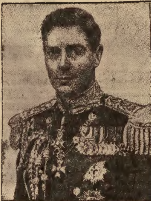
Król Jerzy VI

Dziś, 12 maja oczy całego Imperium Brytyjskiego będą zwrócone na Londyn, dziś odbędzie się bowiem w stolicy Anglii ceremonia, do której go rączkowo przygotowano się w ciągu długich miesięcy; dziś król Jerzy VI i królowa Elżbieta zostaną ukoronowani.