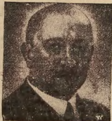
Polska Akademia Literatury na plenarnym zebraniu w dniu 2-go czerwca b. r. wybrała nowym akademikiem Literatury — Kornela Matuszyńskiego, znanego i b. popularnego poe, pisarza i noweliste, ur. w 1884 r.

Sąd, po przeprowadzeniu rozprawy, wydał wyrok skazujący 52-letniego Cichockiego na karę 4 lat więzienia, a po odbyciu tej kary na zamknięcie w zakładzie dla nieoprawnych przestępców w Warszawie.