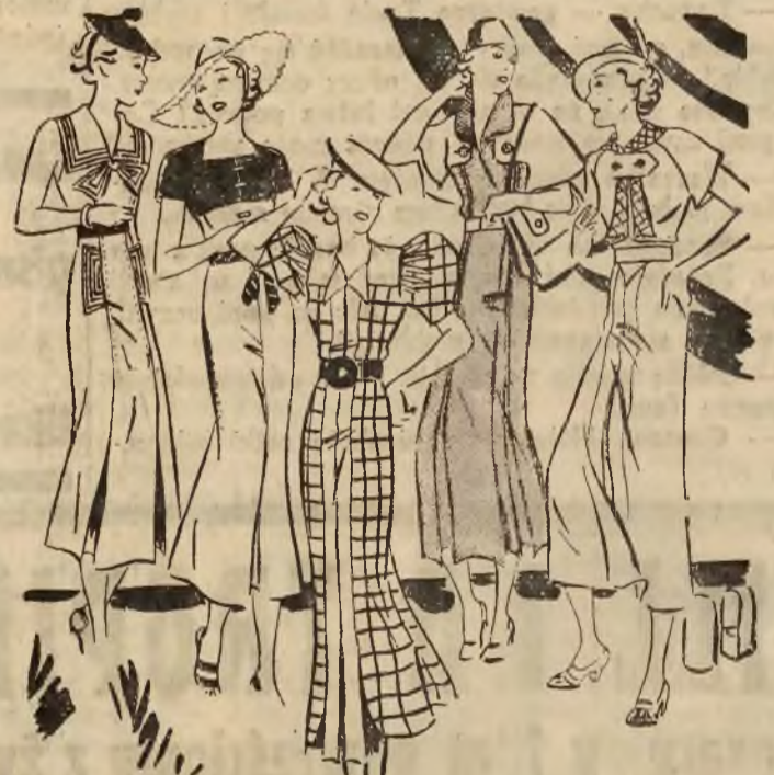
Len jest ciągle modny i nadaje się jak widać z rysunku do bardzo różnorodnych strojów na lato.