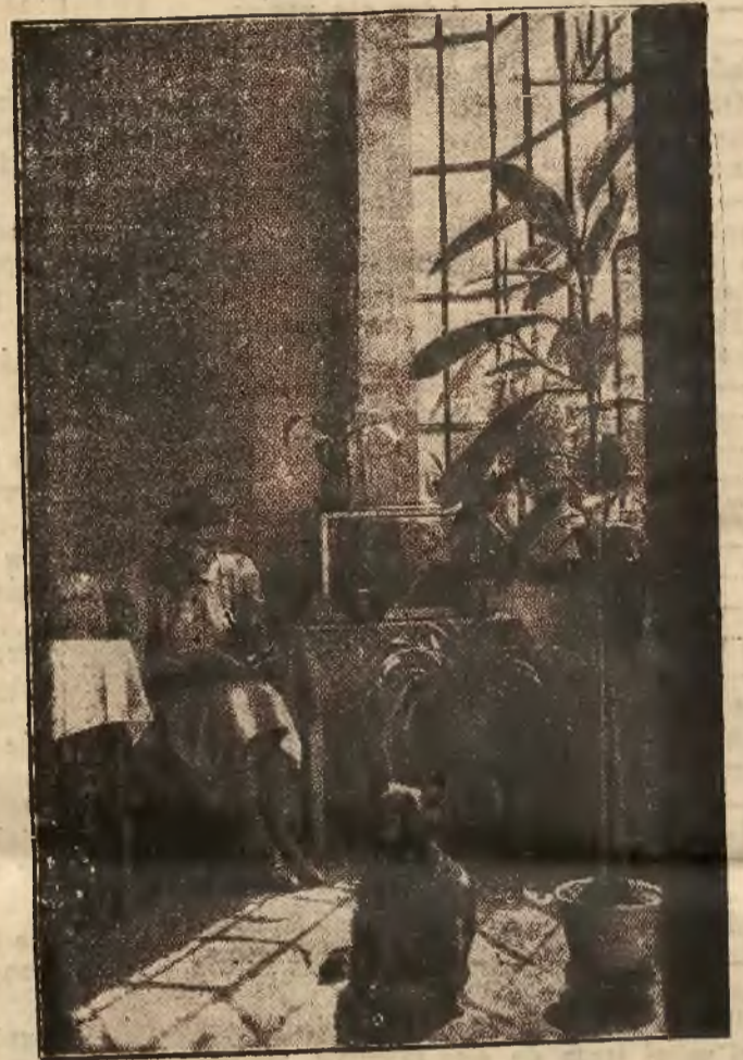
Przyjemny jest wypoczynek świąteczny w tak urządzonym mieszkanku.

niósł Chorzów w stosunku punktów 119,5:84,5. Z powodu roznośkiej biegni, wyniki uzyskane na zawodach są słabe.