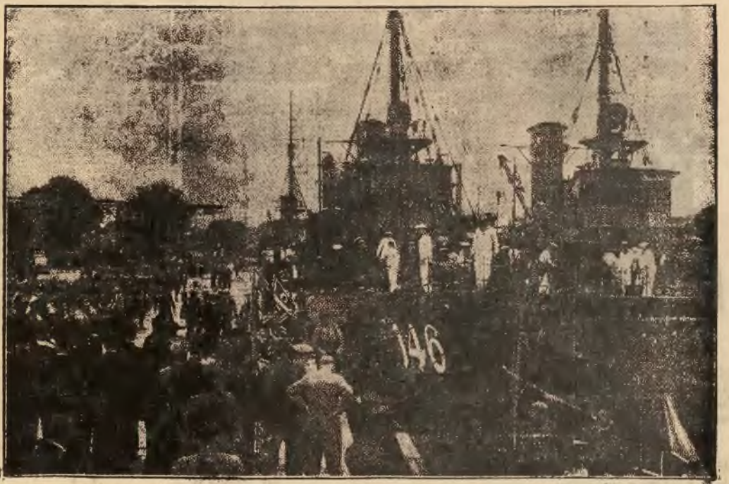
Do portu Gdańskiego zawinęła z wizytą flotylla połowiaczy min niemieckiej marynarki wojennej. Na zdjęciu powitanie okrętów w porcie.