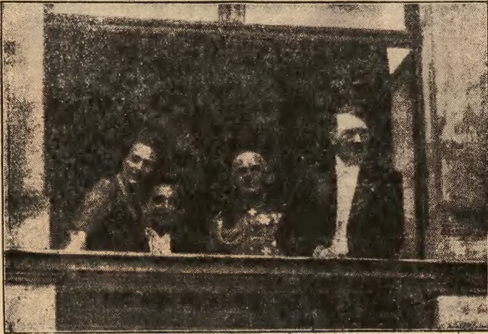
Kancelarz Hitler, który przybył na przedstawienie opery Wagnerowskiej „Parsival”, z okna teatru ukazuje się wiwatującym na jego cześć tłumom. Obok kancelarza stoją: Marszałek von Blomberg, minister Goebbels i pani Wilmfred Wagner.