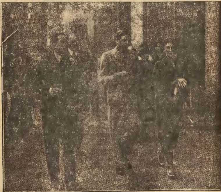
Księstwo Kentu w otoczeniu polskich arystokratów podczas zwiedzania Krakowa.

Wszczęto proces przeciwko angielskiemu skarbowi o zwrot spadku. Proces został wygrany i po przeszło 130 latach spadek znalazł się w rękach prawowi- tych spadkobierców.