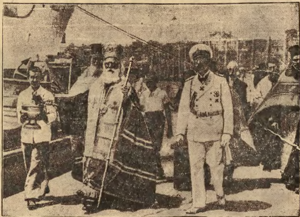
Król Borys uroczystie otworzył nowy port bułgarski na Morzu Czarnym. Na zdjęciu monarcha z arcybiskupem Ilicem.