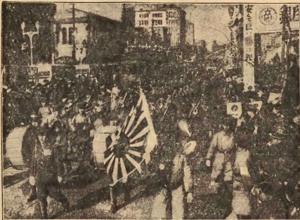
Nasze zdjęcie przedstawia wojska japońskie na ulicach Tokio, żegnane manifestacyjnie przed wyjazdem na front wojenny do Chin.