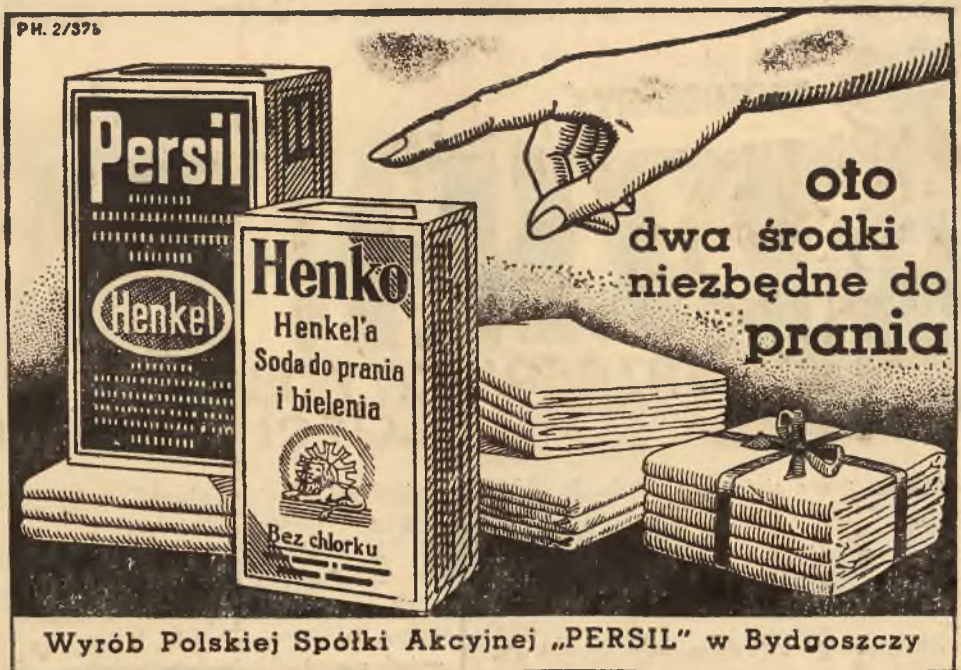
Wyrób Polskiej Spółki Akcyjnej „PERSIL” w Bydgoszczy

ELEKTROTRIT RADIO odbiornik najwyższej klasy