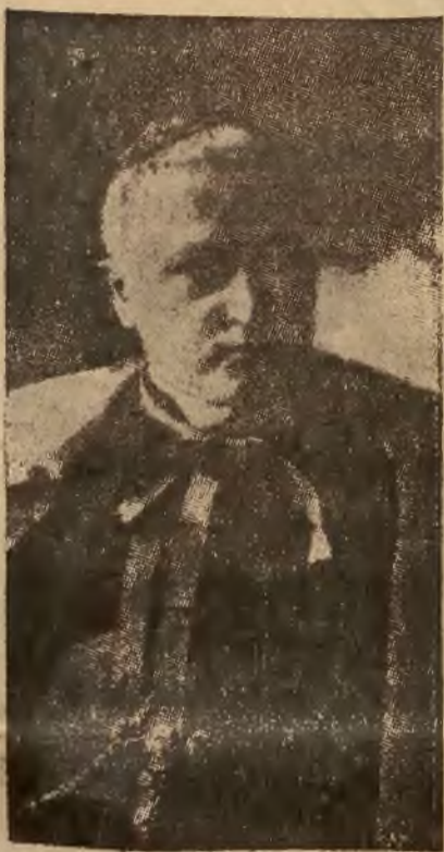
Prymas Polski kardynał August Hlond

Tego zdania są koła, zbliżone do Watykanu