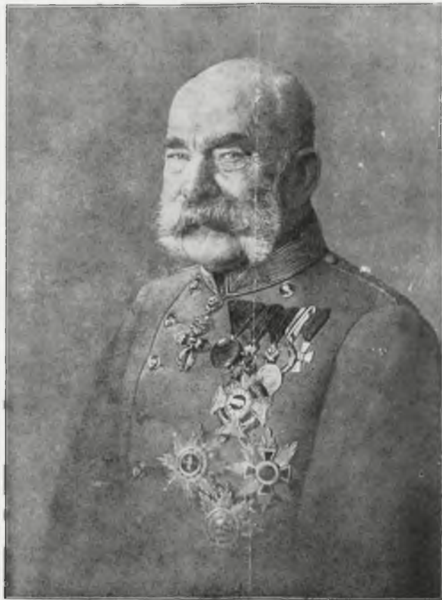
FRANCISZEK JÓZEF I.