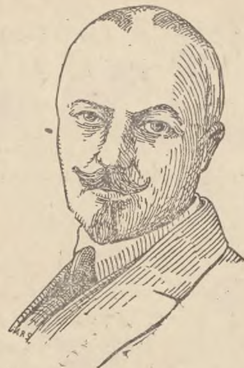
NOWY MINISTER OŚWIATY

Art. XXVI. Wykonanie niniejszej ustawy poleca się Prezydentowi Rady ministrów.