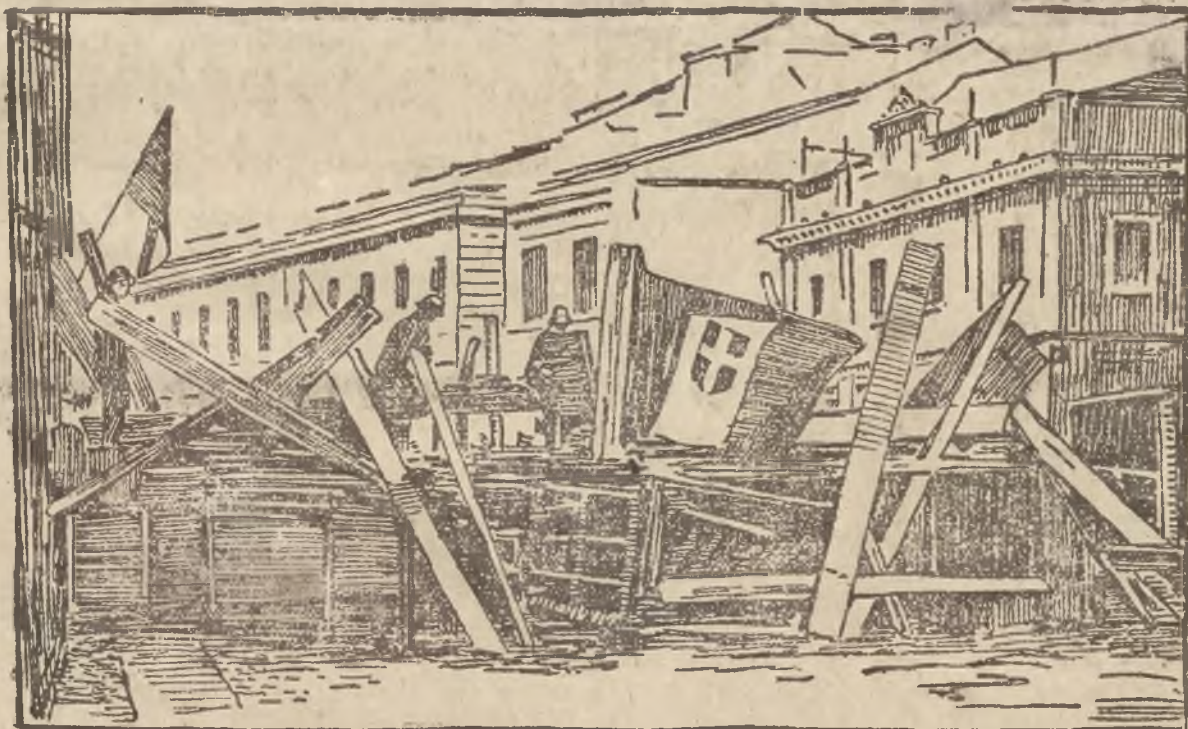
Barykada faszystów na ulicy S. Marco w Medjolanie podczas ostatniego przesilenia.