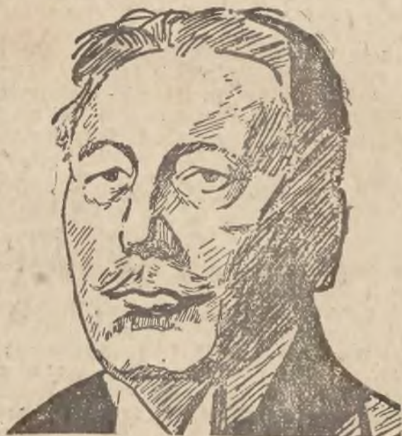
WOJCIECH TRAMPCZYŃSKI, marszałek Senatu.