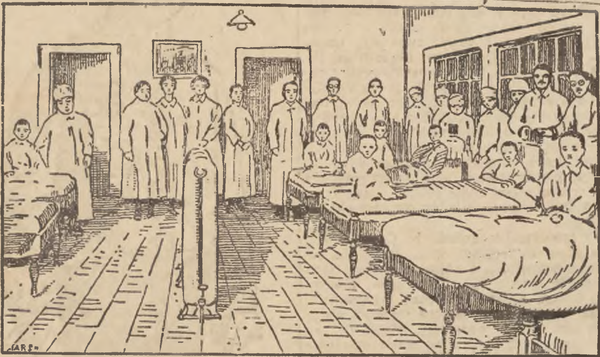
Sieroty polskie w szpitalu Japońskiego Czerwonego Krzyża w Tokio.