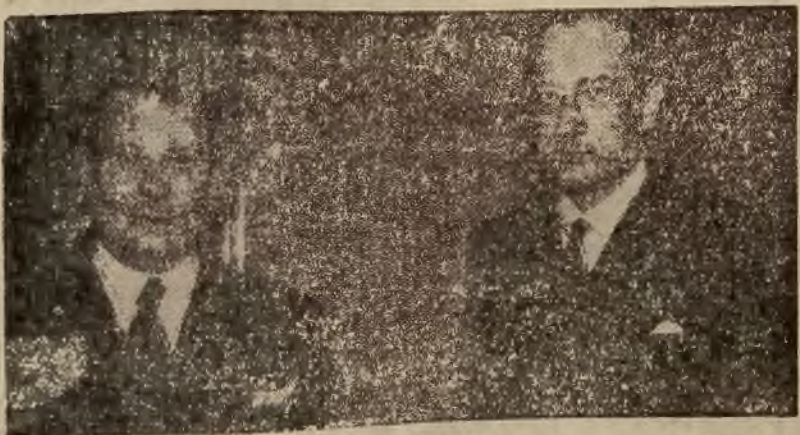
Zdjęcie nasze przedstawia Goeringa u ministra Spraw Zagranicznych Józefa Becka.