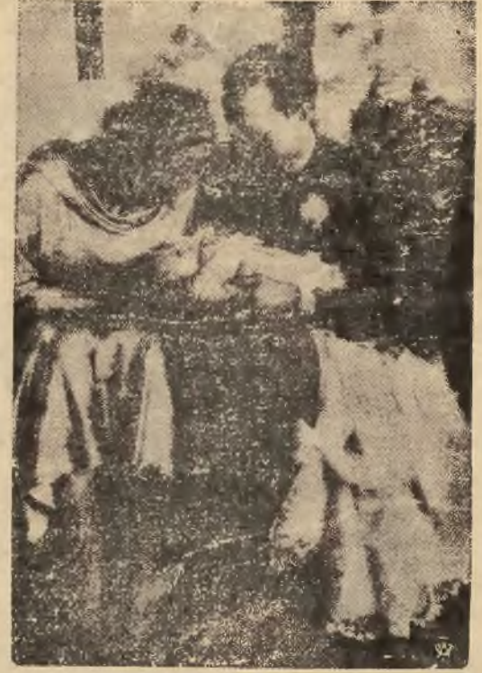
Szczęśliwi rodzice: księżna Julianna i książę Bernardt wraz ze swą córką ks. Beatrycą.