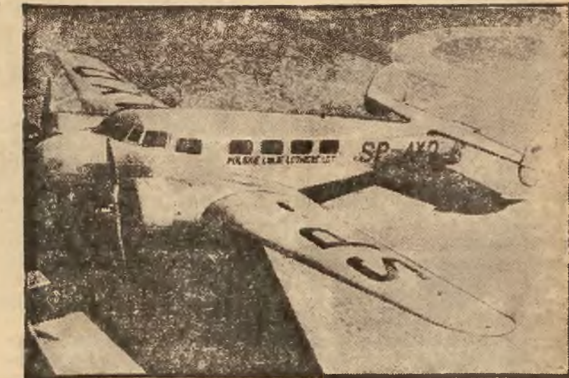
Samolot pasażerski P.L.L. „Lot“ typu „Lockheed - Electra 10. A.“, wyposażony w dwa silniki „Wasp - Junior S. B.“ po 400 K.M. Przy pełnym obciążeniu (12 osób i bagaż) osiąga on szybkość 327 km/godz.

W chwili obecnej płatowce „Lotu“ utrzymują stałe połączenie z Warszawy do: Gdańska, Gdyni, Poznania, Berlina, Ka-