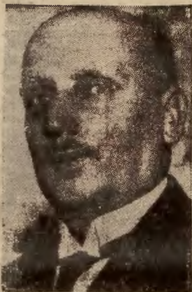
Prezydent Austrii Miklas.

Wielkie mocarstwa nie są zdolne zaprotestować czynem