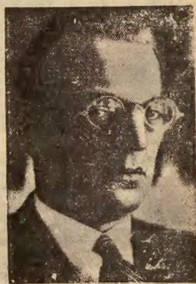
Kanclerz Austrii Seyss-Inquart.

WIEDEŃ. (PAT). — Przymusowo wy zarząd tutejszego dziennika narodo - socjalistycznego „Wiener Neuste Nachrichten“ ustąpił miejsca zarządowi właścicieli wy dawnictwa, rekrutujących się wśród zwolenników narodowego - socjalizmu.