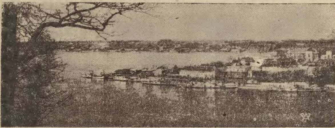
Reprodukujemy rzut oka na zlewisko Niemna i Wilii pod Kownem.

W uzupełnieniu wczorajszych informacji o dymisji rządu pre-