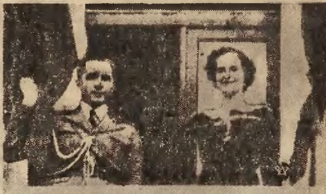
W stolicy Albanii Tiranie, odbyły się z niezwykłym przepychem zaślubiny króla Albanii Zogu I-go z węgierską hrabianką Geraldiną Apponyi. Na zdjęciu — król i nowożeńcy z balkonów pałacu w Tiranie za owacje tłumów.

Jak się dowiadujemy, wszyscy nielegalni przybysze zostali na terenie Stanów Zjednoczonych zatrzymani przez policję amerykańską i po odciernieniu kary za nieprawne przybycie przewiezieni będą z powrotem do Polski.