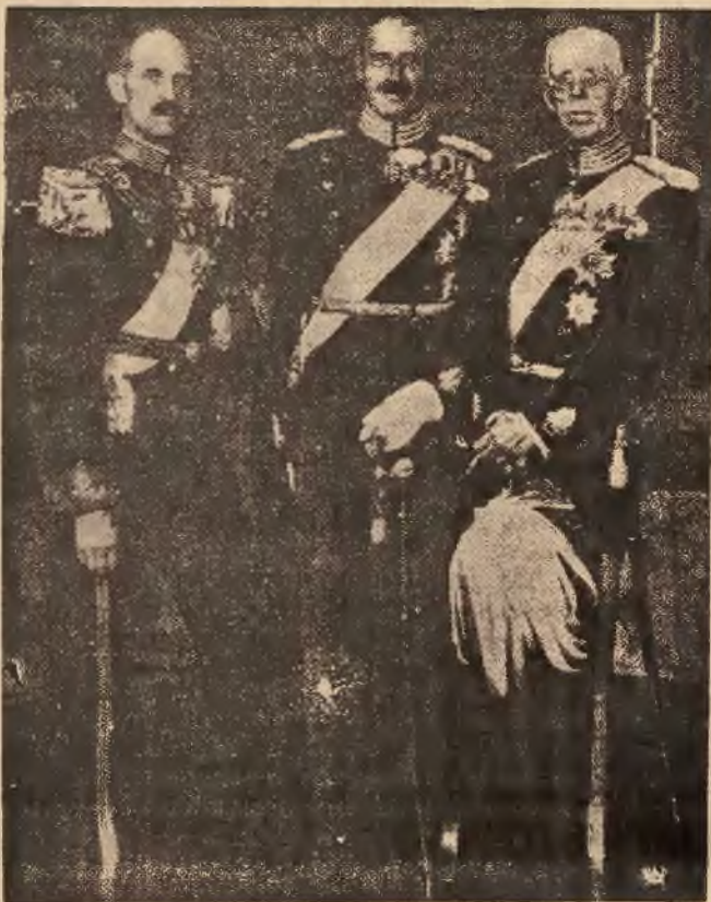
Na zdjęciu — król Szwecji Gustaw V-ty, który obchodził jubileusz 80-jej rocznicy swych urodzin, wraz z gośćmi królewskimi, przybyłymi do Sztokholmu na uroczystości jubileuszowe.

On: — Na tym, aby zarabiać więcej i prędzej, niż rodzina może wydać!