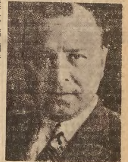
W sobotę, o godzinie 5-ej rano zmarł w Warszawie, po długotrwałej chorobie, Marszałek Sejmu Rzeczypospolitej, ś.p. Stanisław Car, jeden z twórców nowej Konstytucji.