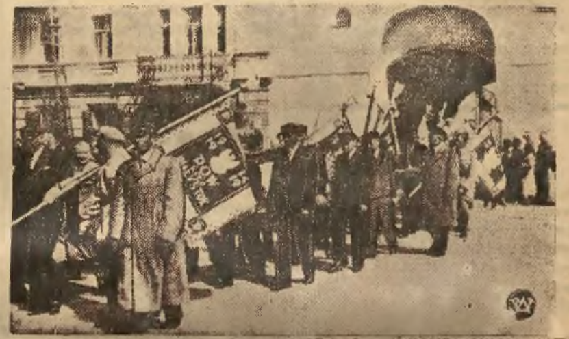
Peowiacy ze sztandarami organizacyjnymi w drodze na cmentarz Rossa w Wilnie, celem złożenia holdu Sercu Marszałka Józefa Piłsudskiego.

Potwornych zbrodniarzy przewieziono do Skierniewic i osadzono w więzieniu, dziećmi zaś ich zaopiekowali się sąsiedzi.