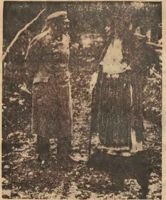
Marszałek Józef Piłsudski i królowa Maria rumuńska podczas wizyty Naczelnika Państwa w Sinaia w 1923 roku.