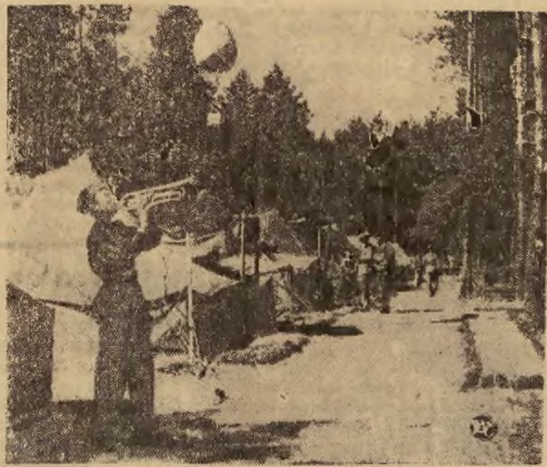
Na zdjęciu fragment z życia obozowego na obozach wyszkoleniowych Legii Akademickiej w Lidzbarku.

Na zakończenie autor wskazuje na czechosłowacki przemysł zbrojeniowy i czechosłowacką „Linie Maginota” dochołzi do wniosku, że Czechosłowacja jest dobrze uzbrojona i przygotowana do odparcia wszelkiego rodzaju nieprzewidzianych wypadków.