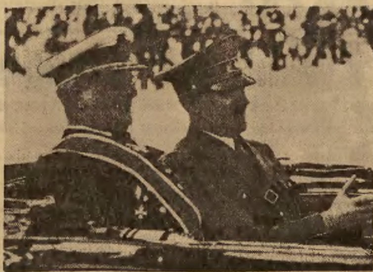
Na zdjęciu regent Węgier admirał Horthy w towarzystwie kanclerza Rzeszy Niemieckiej Hitlera w Kilonii

Instrukcje były przewożone z Pragi przez granicę w tubach od pasty do zębów.